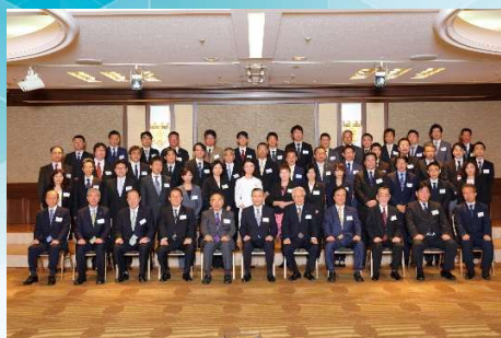
病院経営管理士教育委員会